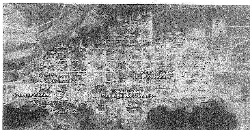
Figura 2 Ubicación del tramo de la vía del proyecto según coordenadas

ASOCIACIÓN SUPRADEPARTAMENTAL DE MUNICIPIOS PARA EL PROGRESO